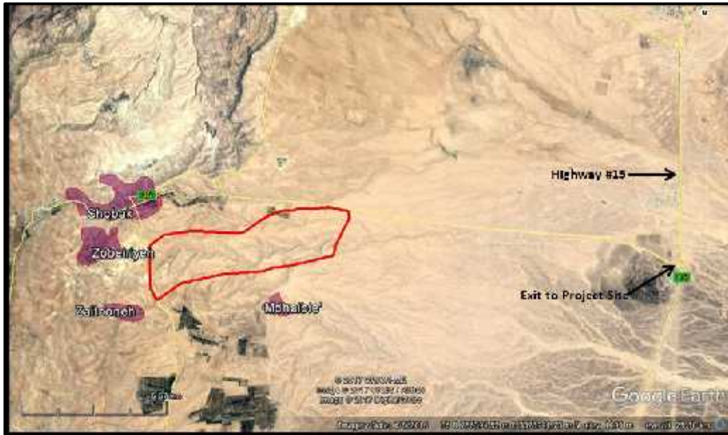
الشكل 1: منظر عام لموقع المشروع

يمكن الوصول إلى موقع المشروع من خلال الطريق السريع رقم 15 (المعروف أيضاً باسم الطريق الصحراوي)، والذي يقع على بعد 13 كم إلى الشرق من موقع المشروع. ويؤدي مخرج الشوبك من الطريق السريع رقم 15 مباشرة إلى موقع المشروع كما هو مبين في الشكل 1 أدياناً. ويبلغ مجموع مساحة المشروع حوالي 14.5 كم 2 أي ما يعادل 14,500 دونم. ومما يجدر ذكره أن جميع الأراضي اللازمة لتطوير المشروع من ملكية الدولة الأردنية.